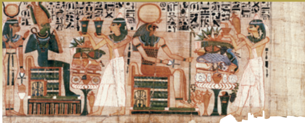
パディコンスの「死者の書」

新型コロナウイルス感染症の今後の状況によっては、混雑時の入場制限等の対応を取らせていただく場合がございます。ご来館の際は、当館ホームページにて最新の情報を必ずご確認ください。