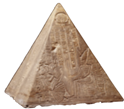
王の書記パウティのピラミディオン