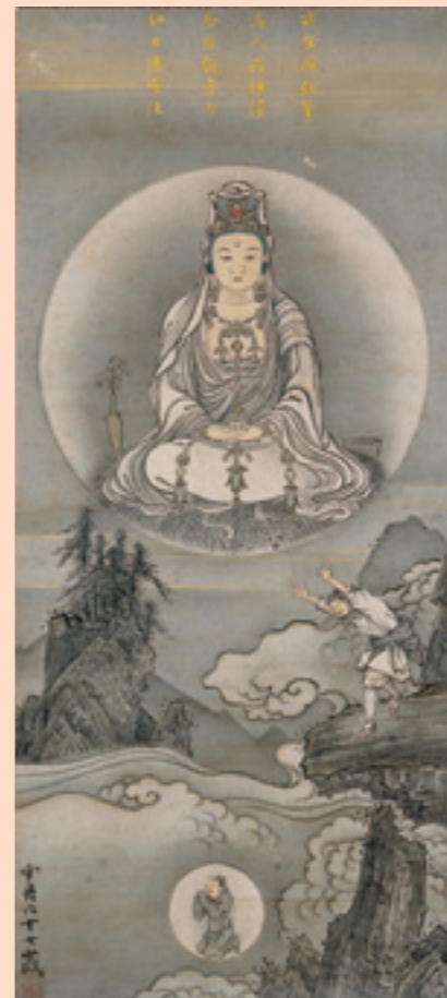
伝雪舟筆 《観音図 如日虚空住幅》 16-17世紀 紙本墨画淡彩 山口県立美術館蔵