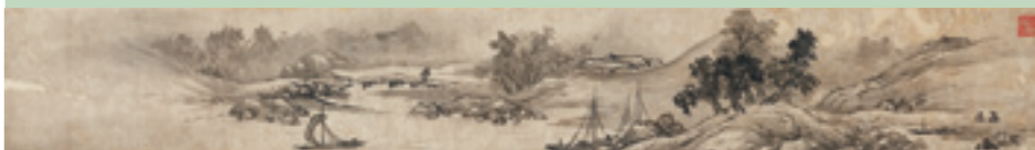
雪舟筆 《山水図巻》 15世紀 紙本墨画 山口県立美術館蔵 重要文化財

当館が所蔵する雪舟筆重要文化財3点、すなわち《山水図巻》・《倣李唐牧牛図(牧童)》・《倣李唐牧牛図(渡河)》を展示します。このうちの《山水図巻》は、江戸時代初期に細川三斎(1563-1646)と木下延俊(1577-1642)という2人の大名によって切断され、掛軸にされていたという数奇な運命をもつ作品です。この《山水図巻》が、掛軸であった時にはどのような形であったかを示す復元複製も展示します。