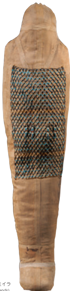
ハレレムのミイラ