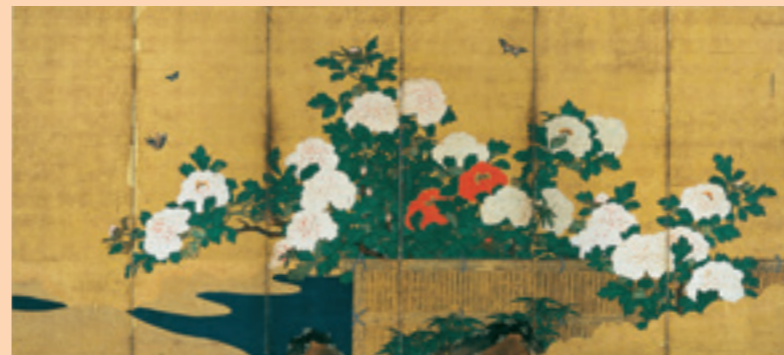
雲谷等恕《牡丹図屏風》右隻 17-18世紀 紙本金地着色 個人蔵(山口県立美術館寄託)

山口は日本絵画史を代表する画家、雪舟等楊(1420-1506?)ゆかりの土地です。この雪舟の画風を継ぐ画家たちのことを“雪舟流”と呼びます。萩藩お抱え絵師・雲谷派の画家たちは、雪舟にならった水墨画を数多く遺していますが、一方で濃彩の金屏風なども少なからず手がけています。金屏風は、室町時代の末から贈答や慶賀の席などに好んで用いられ、江戸時代は流派を問わず盛んに描かれました。このたびは、雲谷派の金色と極彩色による花鳥図屏風を紹介し、きらびやかな花鳥画の世界をお楽しみください。