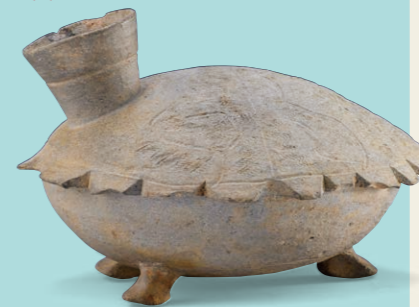
広島県指定重要文化財 亀形須恵器(広島県安芸高田市一ツ町古墳出土) 7世紀前半 個人蔵

1600年ほど前の古墳時代に生まれたやきもの須恵器は、朝鮮半島から伝わった生産技術で作られるようになり、その後の日本における陶磁器生産の礎となりました。須恵器が使用されていた平安時代までの約500年という間には、古墳時代には古墳と言う当時の墓で行われた祭祀で使われ、飛鳥時代以降は寺院の仏具として、また宮都で行われる饗応の器として使われるようになり、時代や用いる場面によってその形を変えていきました。本展では、使われるシーンによって様々な形を作った須恵器の名品を集め、現代人の想像を超えるその造形美を紹介します。